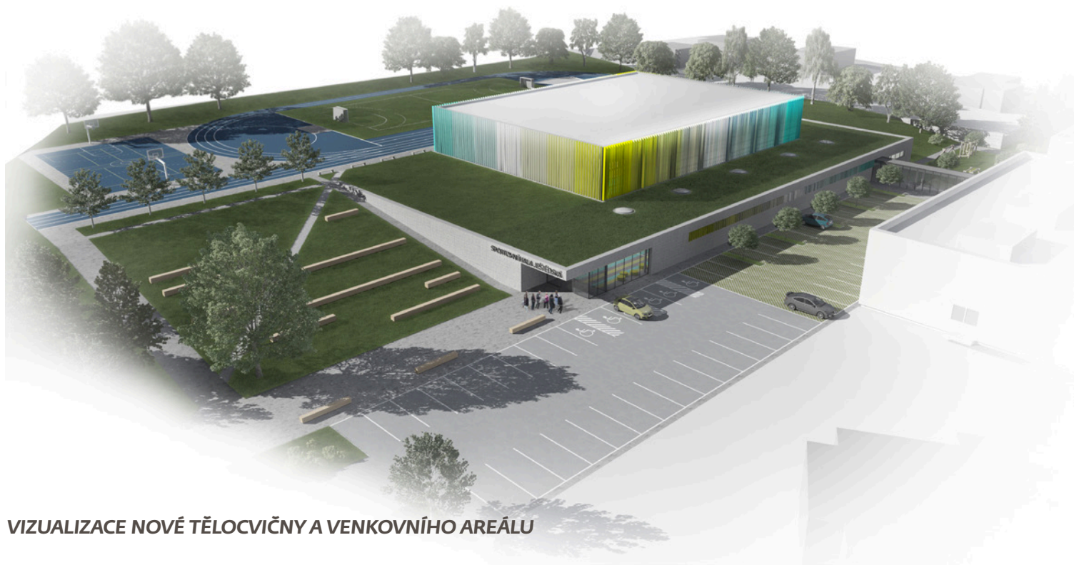
VIZUALIZACE NOVÉ TĚLOCVIČNY A VENKOVNÍHO AREÁLU