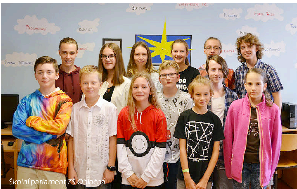
Školní parlament ZŠ Oblačná