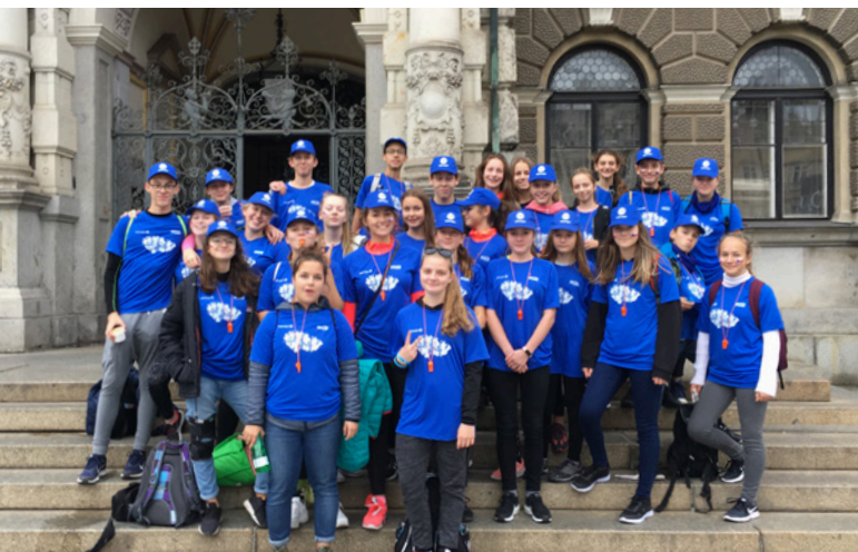
ŽÁCI POMÁHALI PŘI ORGANIZACI ZÁVODU NATURE RUN

V neděli 7. října se v Liberci konal první ročník Liberec Nature Run. Běžci si mohli vybrat kratší (12 km) nebo delší (22 km) trasu. Součástí programu byl také rodinný běh (2,5 km). Všechny tři závody startovaly na náměstí Dr. E. Beneše, kam se také vracely do cíle. Nejdelsí závod vedl přes Masarykovu třídu, skrz Žulový lom až k přehradě Černá Nisa a pak přes jizerské kopečky zpět do cíle. Rodinný závod se odehrával v centru města, okolí bazénu a bývalých Výstavních trhů.