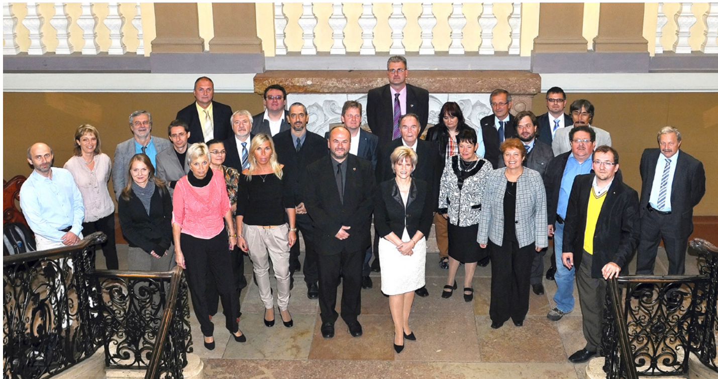
Zastupitelé zvolení na období 2010–2014 se rozloučili 25. září na posledním řádném zasedání před volbami.