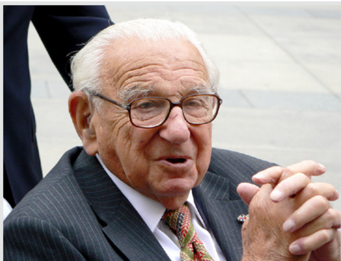
HRDINA. Sir Nicholas Winton na návštěvě v Praze v roce 2007.

Nominaci sira Nicholase Wintona na Nobelovu cenu míru oficiálně podala předsedkyně Poslanecké sněmovny Miroslava Němcová. Organizátoři petice jsou přesvědčení o tom, že co největší množství hlasů pod peticí může ovlivnit samotné udělení Nobelovy ceny míru. Smyslem petiční akce