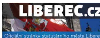
Oficiální stránky statutárního města Liberec