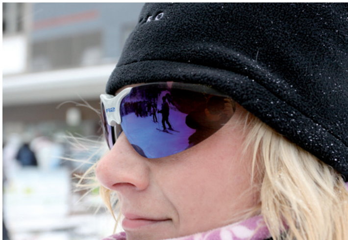
Závěr sezony. Ještěd se rozloučil závodem. Lidem se líbil.

Lyžaři letos ocenili novinky jako novou sjezdovku na Pláních a vybudování snowparku. „Při světovém poháru v běžeckém sprintu i při závodech EYOWF jsme byli vysoko hodnoceni především za profesionální přípravu tratí, můstku a logistickou podporu. Proběhlo i několik menších