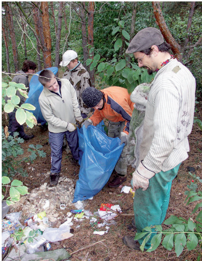
Uklidme svět. Na duben jsou připraveny v Liberci tři úklidové akce.

V minulých letech byla akce podporována z městského Ekofondu, likvidaci nerecyklovatelných odpadů spon-