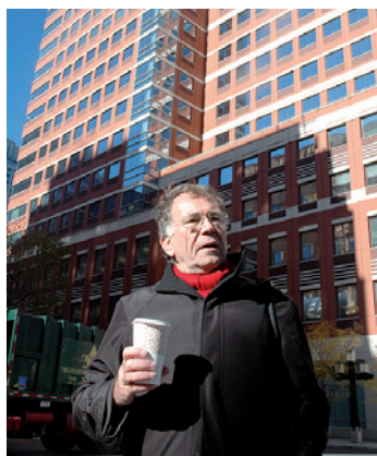
Profesor Jan Gehl.

„Městské plánování, které se v posledních padesáti letech zaměřovalo na dopravní infrastrukturu a automobily, se dostalo do slepé uličky. Města 21. století potřebují být