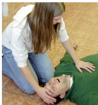
Záchrana. Děti se učí poskytovat první pomoc.

fondem a státním rozpočtem České republiky. ●