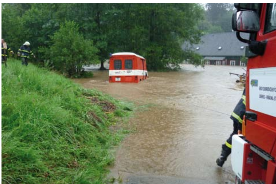
Do problémů se dostávali i sami hasiči. Na snímku potopené vozidlo hasičů z Nové Vsi, jimž přijeli na pomoc dobrovolní hasiči z Krásné Studánky

Statutární město Liberec děkuje a velmi si váží všech, kteří projeví solidaritu s lidmi ze zatopených oblastí, pomáhali při záchranných pracích i s likvidací následků ničivé povodně. (RED)