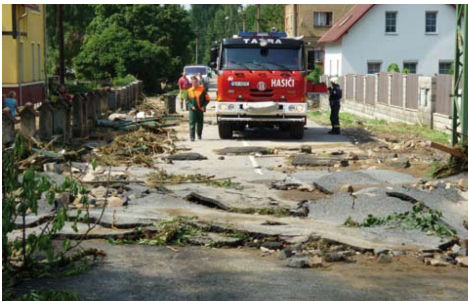
Takto vypadala komunikace Frýdlantské ulice v Chrastavě těsně po povodni