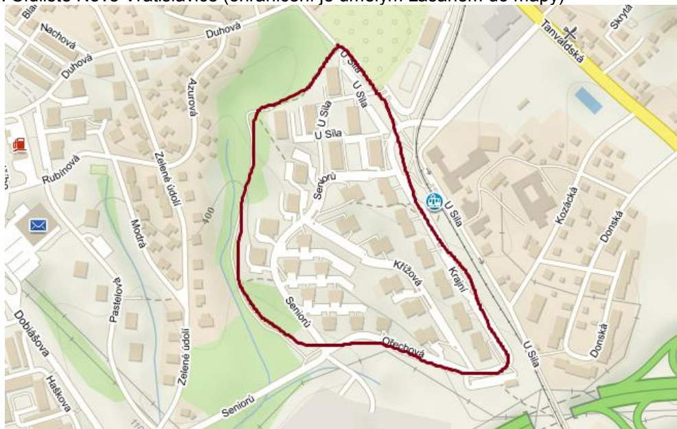
Mapa č. 1: Sídliště Nové Vratislavice (ohraničení je umělým zásahem do mapy)

Nyní se podíváme na jednotlivé ulice s městskými byty: V ulici Krajní se nachází celkem 192 městských bytů . Z toho je 168 startovacích bytů, 24 bezbariérových. V rámci počtu 192 bytů je dále následující specifikace: 4 byty jsou v režimu prostupného bydlení a 2 byty v režimu HF. Byty v ulici Krajní jsou relativně vysoké kvality (stavby dokončené v období 2005-2006) umístěné ve středně vysokých pěti-podlažních bytových domech. Startovací byty byly původně určeny pro mladé osoby a rodiny s tím, že se počítalo s jejich postupným přecházením na volný trh s bydlením. Byty jsou ovšem přidělovány i jiné cílové skupině (např. senioři) a část nájemníků